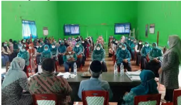
Gambar 1. Pelatihan Kompetensi dan Bimbingan Digital Marketing

Pertama, peserta kemudian berdiskusi untuk menetapkan terlebih dahulu brand. Setelah itu, peserta yang mampu langsung melakukan pemotretan dengan telpon seluler, dan merangkainya dalam dua aplikasi yang diajarkan oleh Tim PKM, yaitu Canva dan sellury. Canva adalah aplikasi untuk melakukan rekayasa foto. Adapun Sellury adalah aplikasi untuk merangkaikan hasil rekayasa foto tadi dengan kata-kata yang diinginkan. Tidak semua peserta langsung dapat mempraktikkan pembuatan karya digital marketing ini. Akan tetapi 22 orang yang mempunyai kemampuan adaptasi yang cepat dengan teknologi smartphone segera langsung dapat melakukannya. Ini terlihat dari hasil karya mereka pada gambar berikut;