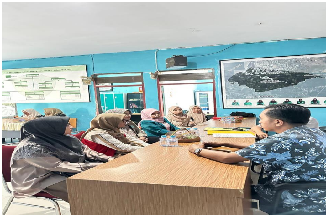
Gambar Sosialisasi di Desa Marannu Kabupaten Maros

Bahasan utama berisi hasil dan pembahasan bukan merupakan data mentah, melainkan data yang sudah diolah/dianalisis dengan metode yang telah ditetapkan. Pembahasan adalah perbandingan hasil yang diperoleh dengan konsep/teori yang ada dalam tinjauan pustaka. Isi hasil dan pembahasan mencakup pernyataan, tabel, gambar, diagram, grafik, sketsa, dan sebagainya.