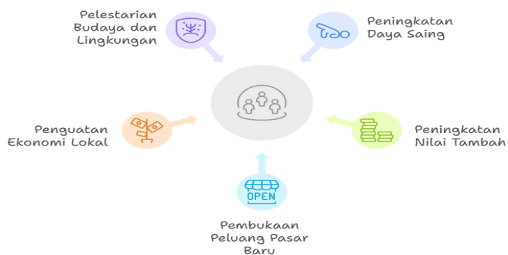
Gambar 2. Faktor-Faktor Pemanfaatan Potensi Lokal